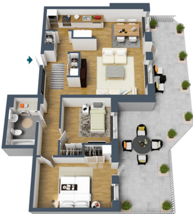
Möblering och inredning är endast exempel och överensstämmer inte med det faktiska utseendet.